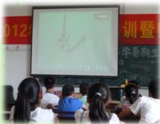
小朋友观看环保电影