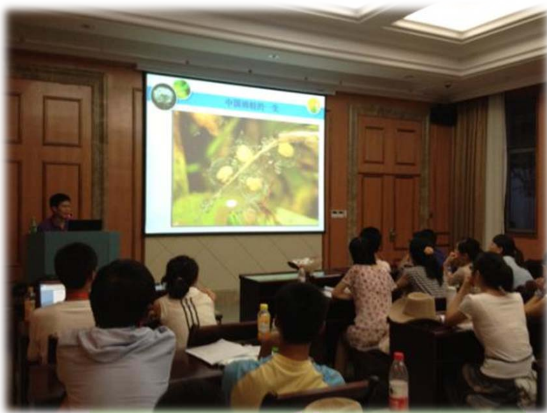
金黎学长向营员们介绍中国雨蛙的一生