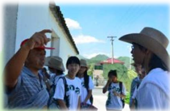
调研报告详见附录 2。