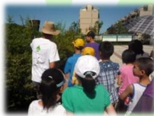
营员带小朋友识别校园植物

7月22日，环教组的志愿者们带领小学生在凤小校园内进行了“给大自然的一份信”活动。上午，孩子们在我们的带领下走进校园的植物世界，对校园内现有的各种植物的名称、科目、特点和用途进行了学习。下午，结合上午学习到的植物知识，在志愿者的指导下，孩子们用纸板和彩纸制作了各式各样的植物名片，并以给大自然写一份信的形式表达了自己对大自然的关爱和今后善待生命、爱护自然的决心。