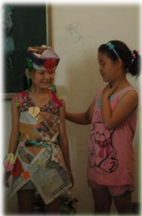
小朋友自己讲解制作的环保时装