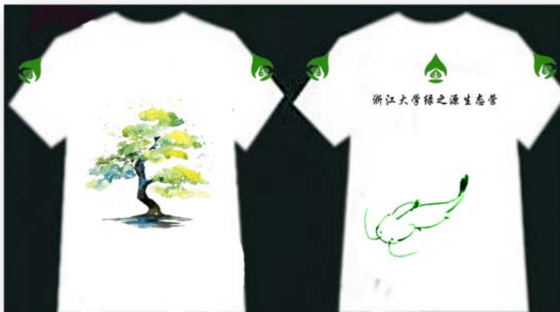
自创营衫电子版样图