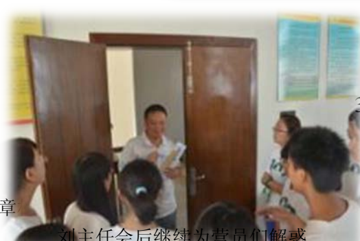
刘主任会后继续为营员们解惑