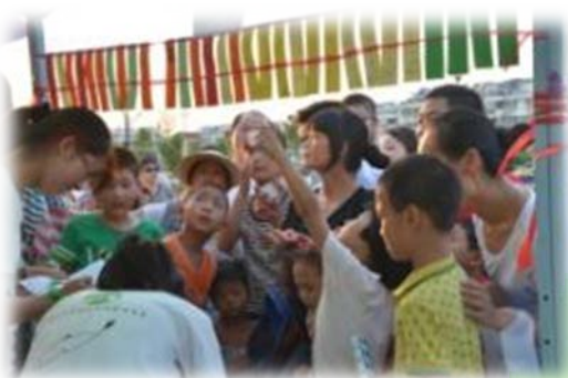
打 到 环 境 污 染