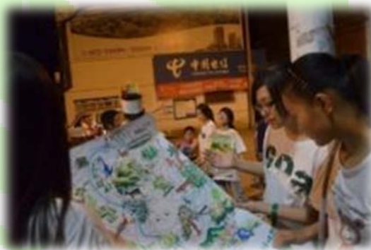
生态营营员向路人展示龙王山绿地图