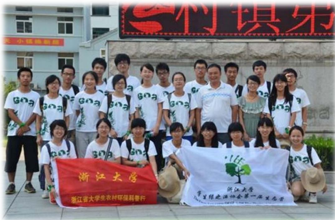
生态营营员与章村镇镇团委陈书记（第二排右二）、刘主任第