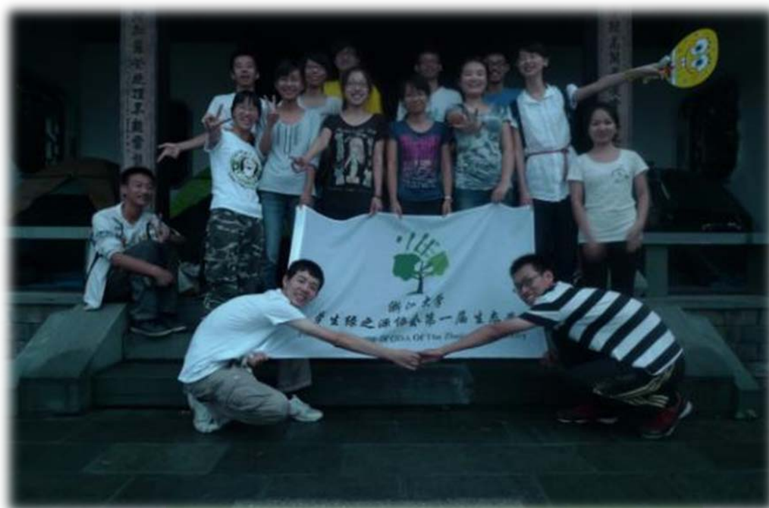
露 营 活 动 望 江 亭 前 集 体 照