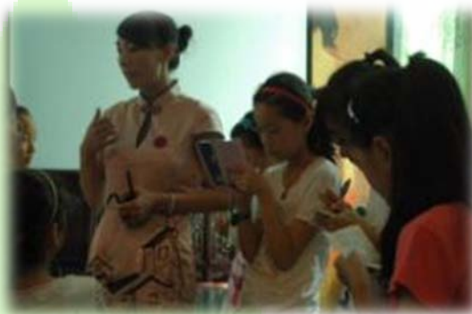
朋友 外出 进行 调研 活动