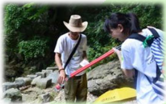
营员入户进行调研