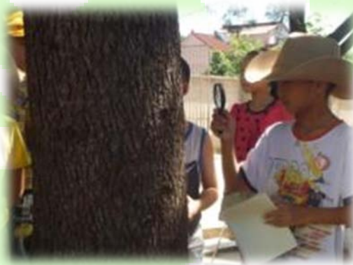
小朋友用放大镜观察