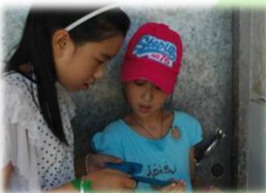
研究卡片上的提示语