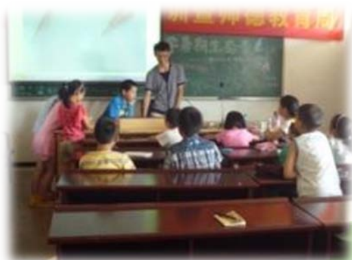
营员为小朋友上课