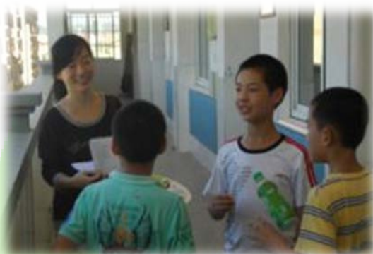
小朋友奔跑着寻找卡片