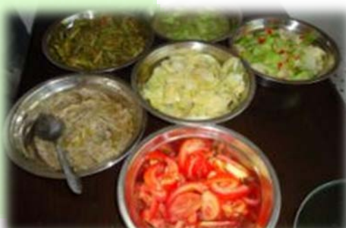
“ 大厨” 三人 行