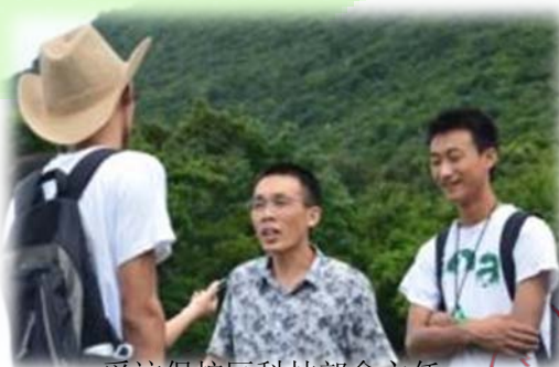
采访保护区科技部俞主任