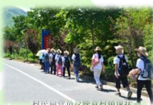
村民向营员反映章村镇现状