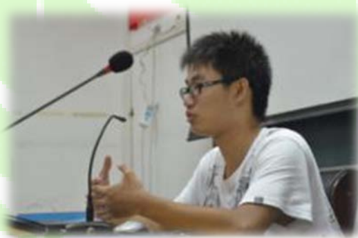
绿之源环境教育部成员为营员做环境教育培训