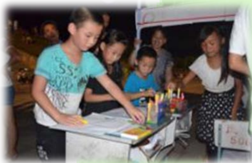
环 保 DIY 现 场