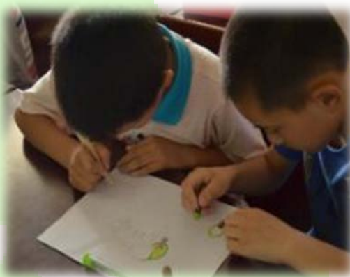
营员 与小 朋友 问答 互动 小朋 友手