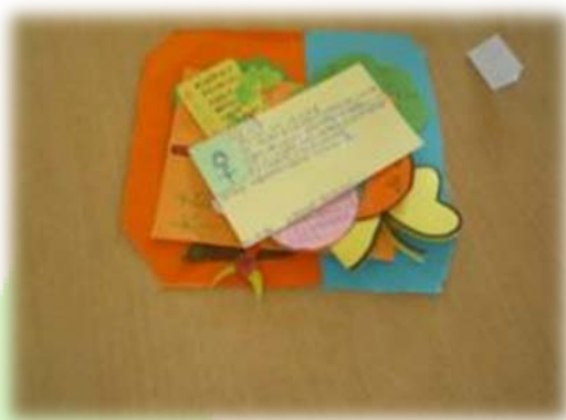
小朋友制作的植物名片